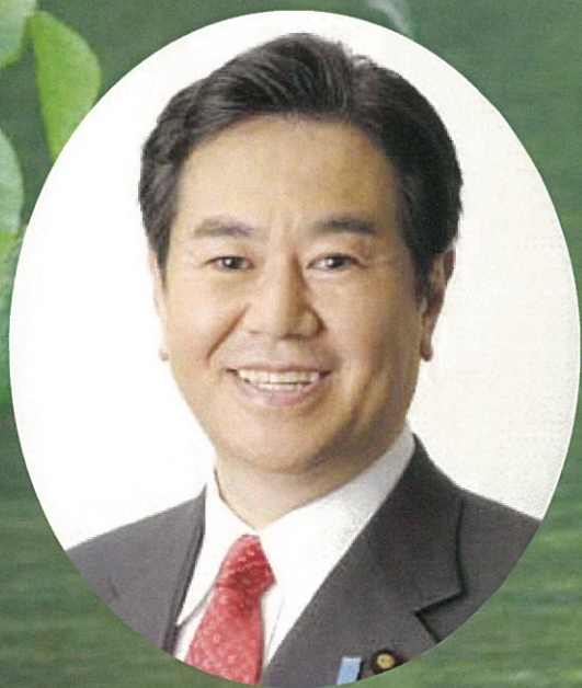
【取り組みへのご提言】 原口 一博 (元総務大臣)

今回、事業の実証調査、セミナーを開催し、地域資源を活かし、「あるものさがし」「あるものいかし」の視点により、地域の自給力を高める持続可能な取り組みを推進していきます。