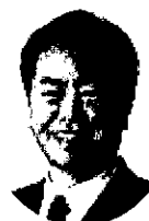
衆議院議員 原口 一博 (元総務大臣)

1959(昭和34)年7月2日生。佐賀市生まれ。東京大学文学部心理学科(第4類心理学)卒業後、(財)松下政経塾の第4期生として入塾。1987(昭和62)年、27歳で佐賀県議会議員初当選を果たし、2期連続当選。1996(平成8)年、37歳で衆議院議員初当選。現在5期目。